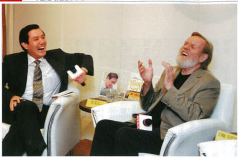
▲2007年奈思比與當時的總統候選人馬英九作文化對話，密特柏直言台灣下一個領導人應坐在身邊，而馬英九當選後也邀請奈思比參加就職典禮。二人並對高雄建上體育館，當時奈思比與馬英九曾商榷商業建議，馬英九卻坐視經濟蕭條，觀察大膽的奈思比隨後又高呼：「他坐在經濟崩壞與外賣。想台灣政府一定有龐大的財政赤字！」而他的觀察真的對了預言也成真。